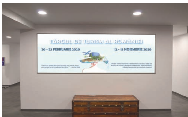
AFISARE BANNERE PAVILION A, FRIZA 7.70