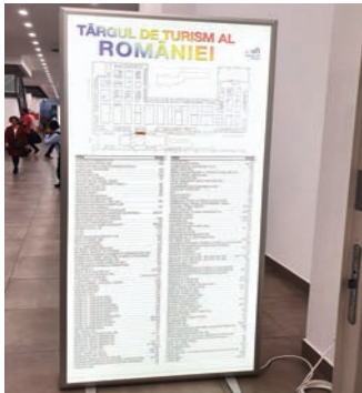
CASETA CU RAMA CLICK, DIMENSIUNE 52.5X106.5 CM